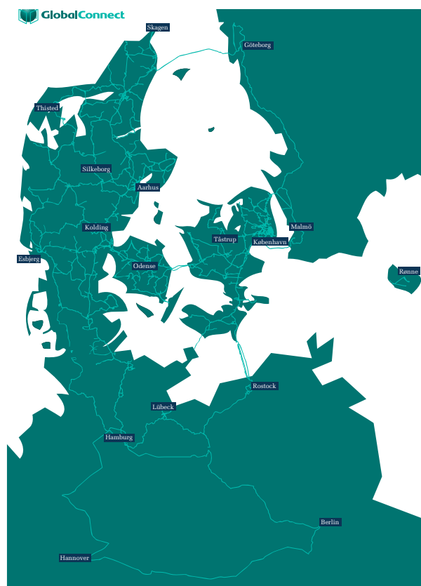
Figur 2: GlobalConnect råder over eget landsdækkende fibernet i Danmark samt i Nordtyskland

Når fibrene er klar til brug, udstedes der et certifikat, som bekræfter, at fibrene lever op til afleveringstesten sammen med en kopi af den relevante dokumentation. GlobalConnect har driftsansvaret til og med stikket på fiberpatchpanelet.